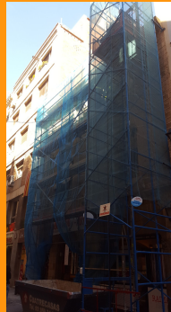
Edifici c/Sevilla (Barri de la Barceloneta):