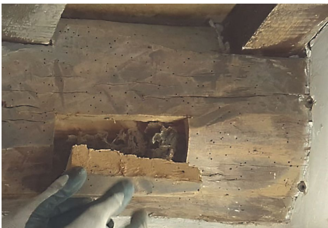
Fig. 2. Obertura d'una finestra a l'albeca per descobrir danys ocults.

Però, gràcies a aparells END específics i a la experiència dels tècnics, es pot comprovar com existeixen danys que resten ocults darrera d'una bona aparença. En aquest cas en concret (figures 2 i 3), amb la aplicació del resistògraf i un altre aparell d'inspecció visual, es van poder detectar danys severos causats per tèrmits subterranis.