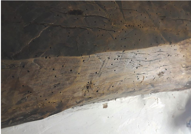
Fig. 1. Forats de sortida de corcs de petita grossària.

Com a exemple, en la figura 1 s'aprecia una biga de fusta amb forats de sortida de corcs de petita grossària, una plaga xilòfaga que en aquest cas no ha produït danys significatius en la fusta. Fins i tot s'ha comprovat com la fusta és resistent davant del punxonament.