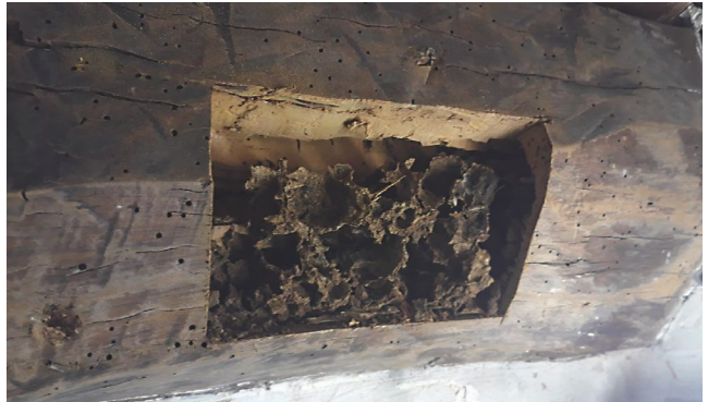
Fig. 3. Construccions terroses de tèrmits subterranis.

El resistograma és la representació gràfica a través de coordenades que relacionen la intensitat emprada per a la penetració de l'agulla amb la profunditat de perforació. Les gràfiques representades mostren la resistència que ofereix la fusta a l'avançament de l'agulla i la resistència de la fusta a la rotació de l'agulla.