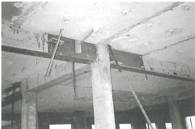
1. Refuerzo de vigas con platabandas pegadas con BETOPOX 920 P.