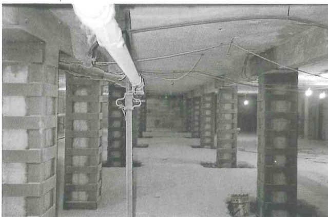
3. Zunchado metálico de pilares a base de angulares y presillas, utilizando BETEC 340 para la transmisión de esfuerzos.